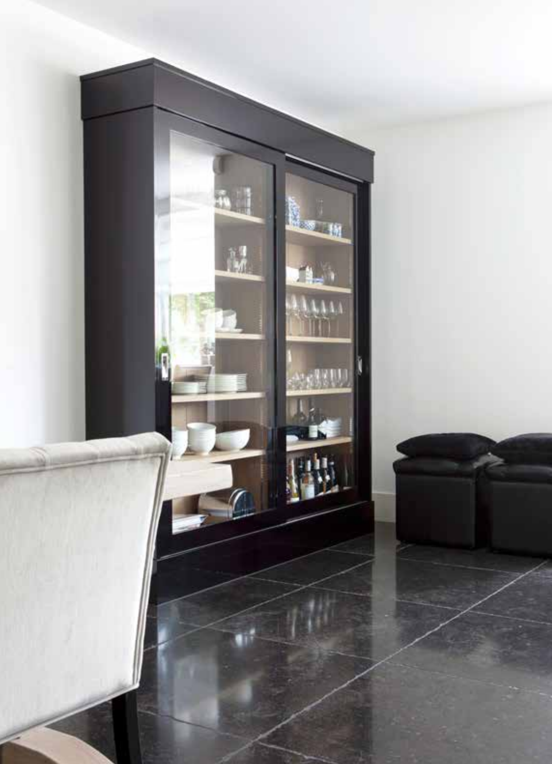
De zwarte servieskast is op maat gemaakt door Arjan Lodder Keukens. De twee zwarte poefjes zijn van Interiors DMF, net als de drie meter lange, eikenhouten eettafel, de gecapitonnerde eetbank en de drie fauteuils. De witte potten op tafel met orchideeën kocht Annemieke bij Zijderveld Garden & Home.